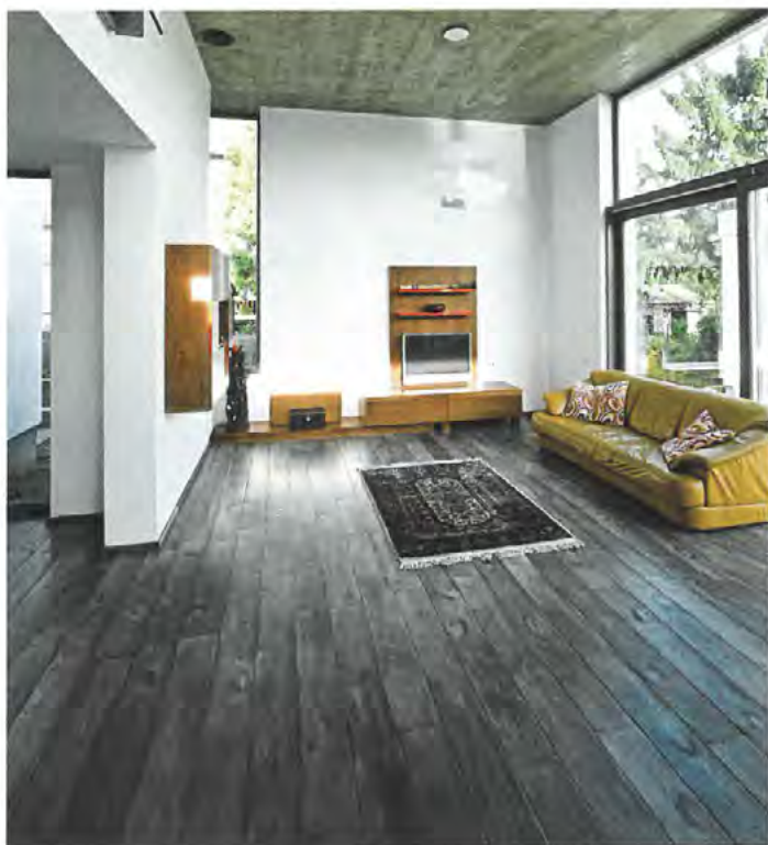
Das neue Sortiment „manufaktur deluxe“ von HKS: Das Highlight sind die sogenannten „Barrique“-Lamellen mit 3D-Struktur.

Das neue Sortiment „manufaktur deluxe“ von HKS besteht aus 22 Oberflächen auf Eiche. Highlight sind nach Unternehmensangaben die Böden mit 5,5 Millimeter dicken, sogenannten „Barrique“-Lamellen. Diese sind nicht kalibriert und durch die manuell ausgearbeiteten Äste entsteht eine 3D-Struktur. Der Einsatz von farbiger Beize, Öl und Wachs sorgt für einen optischen und haptischen Wohlfühl-Effekt. Die mehrschichtigen Böden werden kundenspezifisch in unterschiedlichen Formaten gefertigt: Als klassische Landhausdielen, als Fischgrät oder im Chevron-Verband. Mögliche Nuttschicht-Dicken sind vier oder 5,5 Millimeter, die Gesamtstärke variiert zwischen 15 und 21 Millimeter. Als Trägermaterial dient formstabile Birken-Multiplex. Bei den Dielen betragen die Breiten 180 oder 220 Millimeter, die Fischgrät- und Chevron-Elemente bewegen sich zwischen 85 und 120 Millimeter Breite, dabei sind die Längen grundsätzlich variabel.