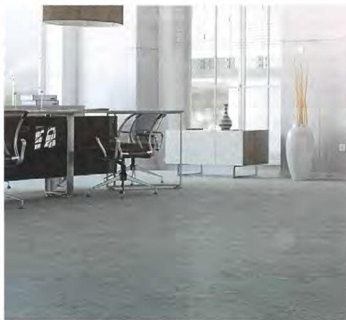
Die neuen Spezial-Füllstoffmischungen der Serie „Granucol FQ“ sorgen für abriebbeständige und UV-stabile Böden.