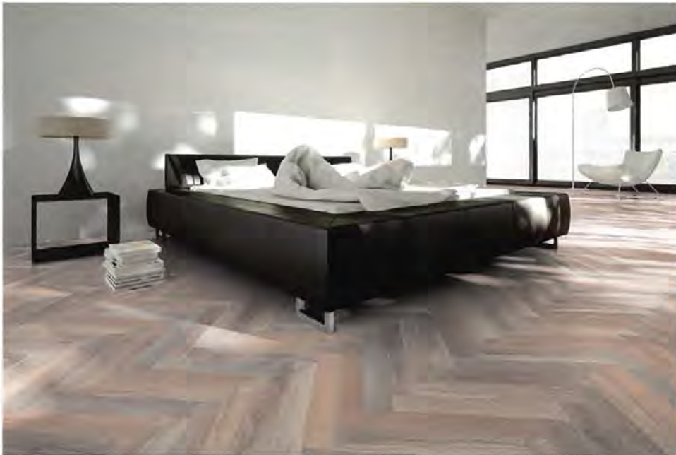
»Caramel«: Fischgrät gebürstet, weiß geölt