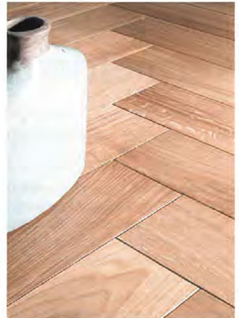
»Pure«: Fischgrät, natur geölt